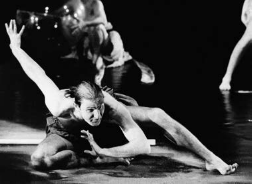
2 | Bachantki , Berlin 1987