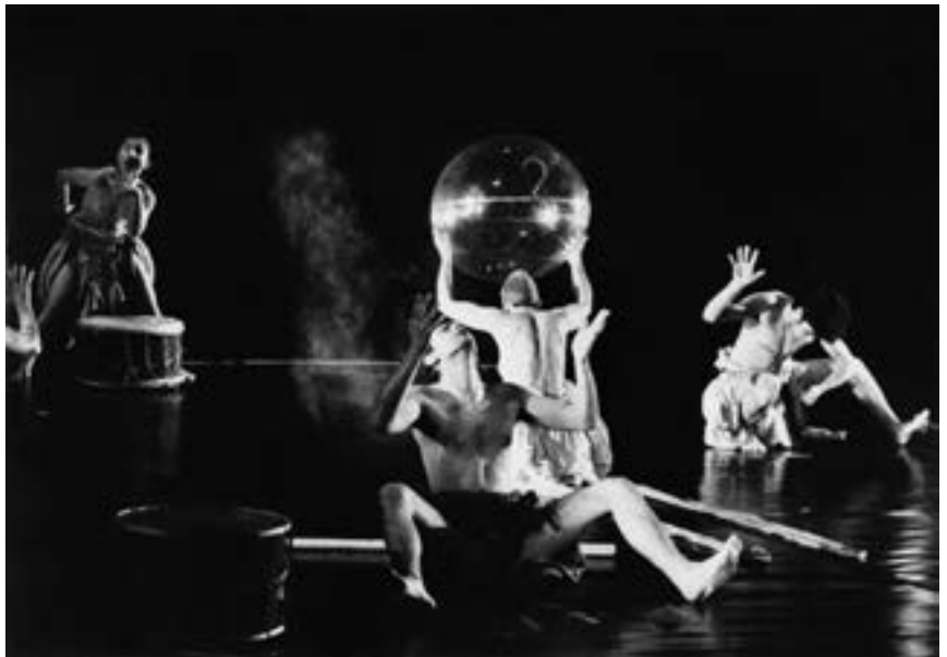
3 | Bachantki , Berlin 1987